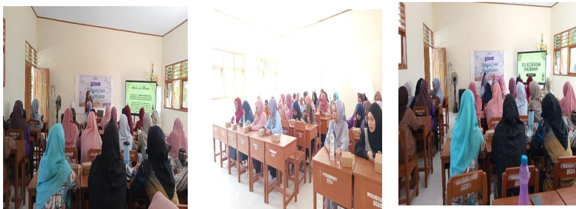
Gambar 2. Penyampaian Materi Edukasi

Dengan demikian, program ini tidak hanya berorientasi pada peningkatan kapasitas finansial, tetapi juga pada pembentukan karakter yang lebih disiplin, bertanggung jawab, dan berlandaskan nilai-nilai keislaman. Dalam jangka panjang, peningkatan literasi keuangan yang terintegrasi dengan penguatan spiritual diharapkan mampu mendukung terwujudnya ketahanan ekonomi keluarga, memperkuat budaya berbagi, serta meningkatkan kualitas kehidupan sosial dan keagamaan peserta. Oleh karena itu, model edukasi yang memadukan manajemen keuangan dan nilai-nilai Islam ini berpotensi untuk direplikasi pada kelompok masyarakat lainnya sebagai salah satu strategi pemberdayaan yang relevan dan berkelanjutan.